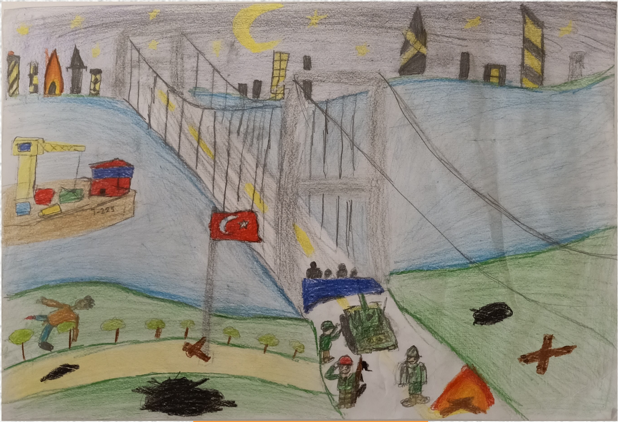
Alperay DURGUT - 4/E