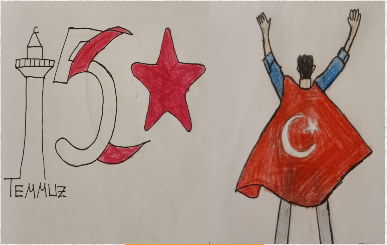
Mert BAĞDEŞ - 4/C