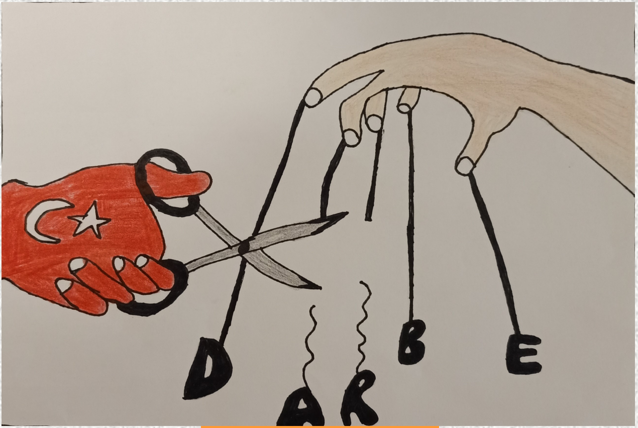
Mert BAĞDEŞ - 4/C