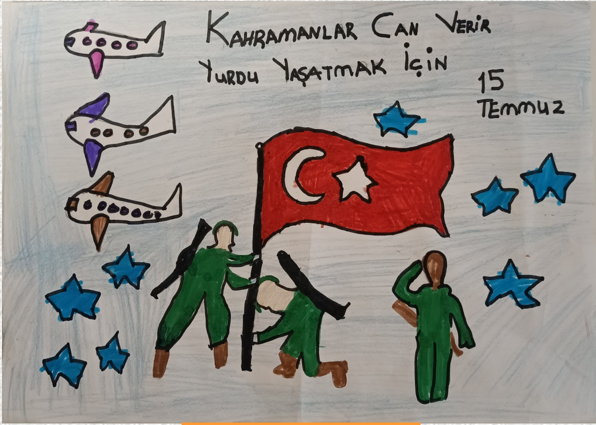
Muhammed Talha SEÇER - 3/D