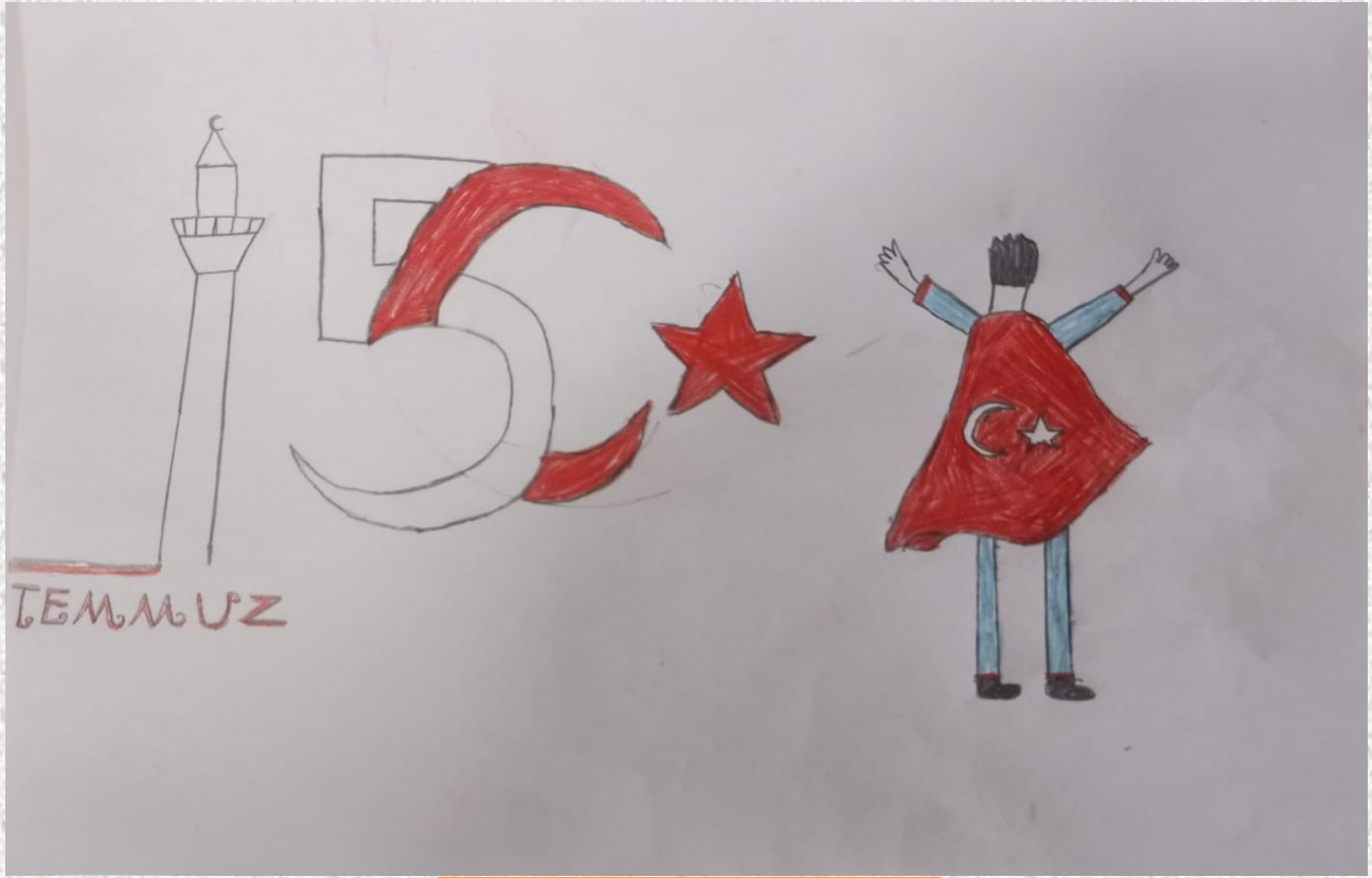
Fatma KASIM - 2/D