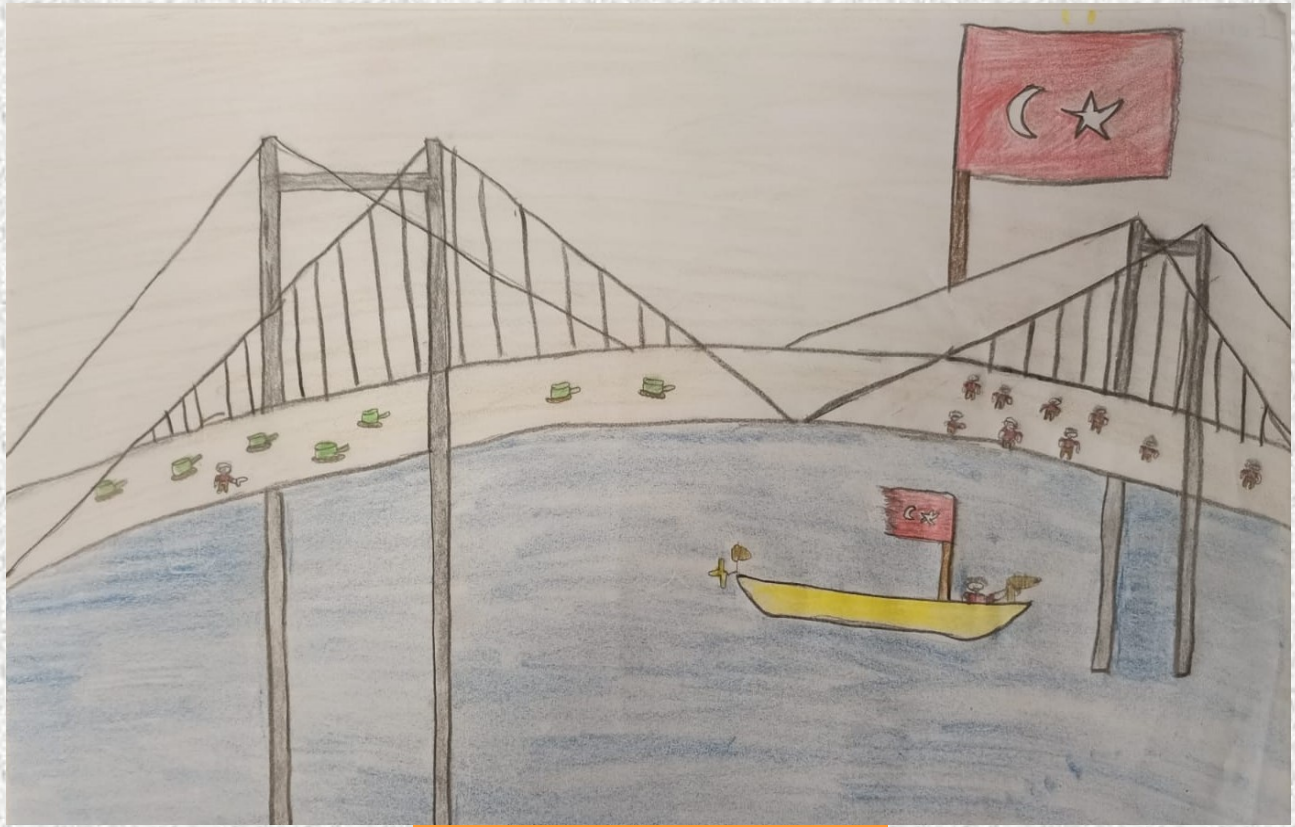
Belinay MAVİŞ - 2/E