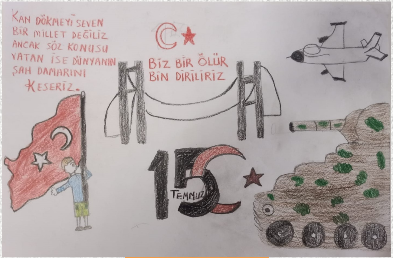
Ayşe Betül YAVUZ - 3/A